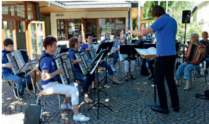
Vor der Tourist-Info in Kirchzartens Fußgängerzone begrüßte der Akkordeonclub Kirchzarten die Stadtradeln-Teilnehmenden.

Nach Kaisers offiziellen Worten: „Das Stadtradeln im Dreisamtal hat