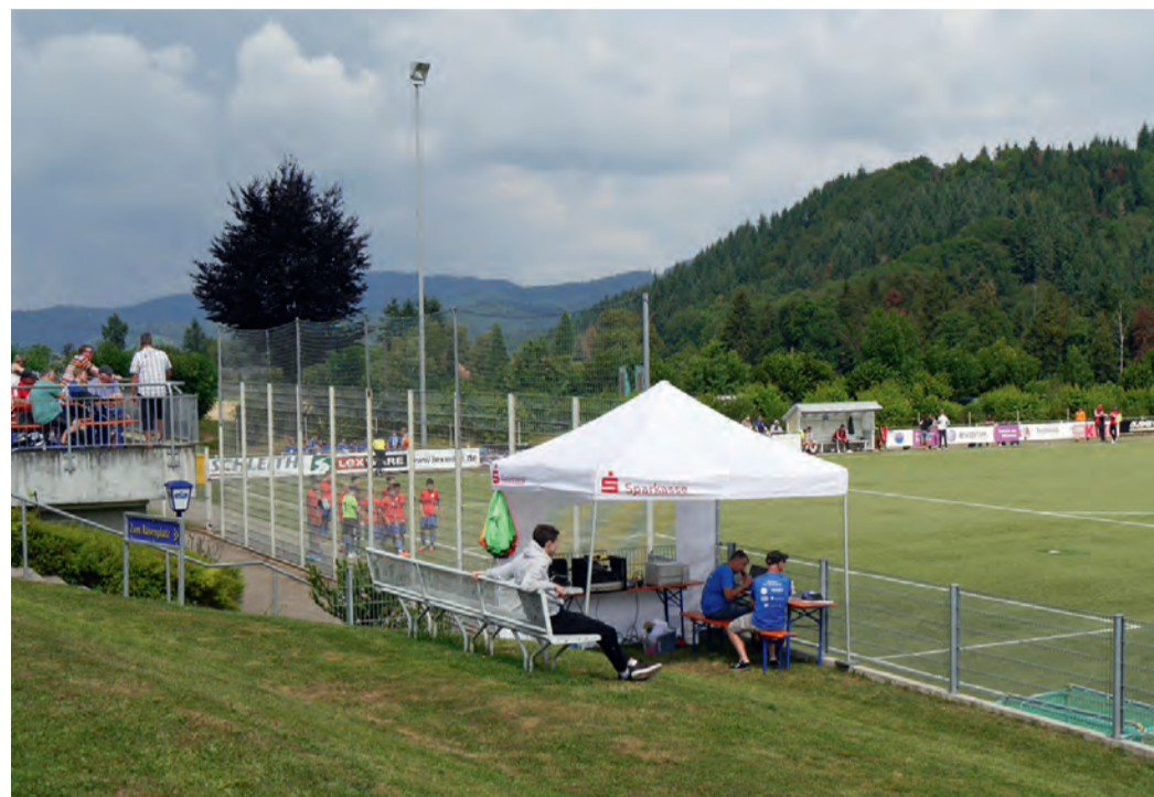
Die Organisatoren überwachen den geregelten Turniervorlauf.