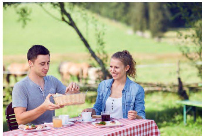
Ein perfekter Brunch-Sonntag auf dem Bauernhof.

Ziel des Naturpark-Brunchs ist es, den Gästen die enge Verbindung zwischen einheimischen Produkten und den Leistungen der Landwirtschaftsbetriebe als Erzeuger und Landschaftspfleger näher zu