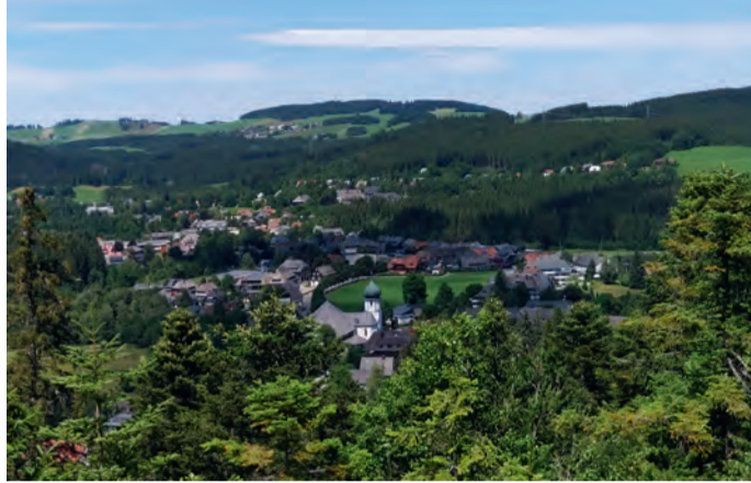
Blick auf Hinterzarten

Tatsch: Wir steuern auch das Grundstück bei, das wir der Bergwacht zu einem symbolischen Erbpachtzins von einem Euro auf 99 Jahre überlassen. Die momentane