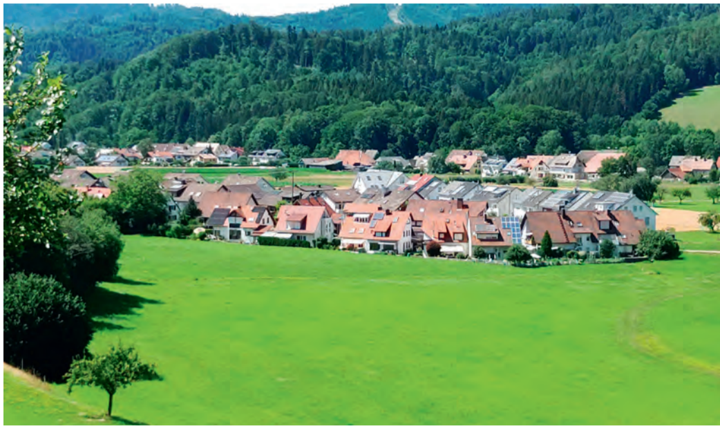
Blick auf den nördlichen Teil des Baugebiets Nadelhof, wo Seniorenwohnen und ein Kindergarten entstehen soll.

Im nordöstlichen Bereich werden Flächen für betreutes Wohnen für Senioren mit fünf zulässigen Wohnungen und einen Kindergarten mit einer Mitarbeiterwohnung ausgewiesen. Im südlichen Bereich werden zum einen Flächen für Wohnhöfe mit Geschosswohnungsbau und alternative Wohnformen zur Verfügung gestellt. Dort könnten 15 Wohneinheiten