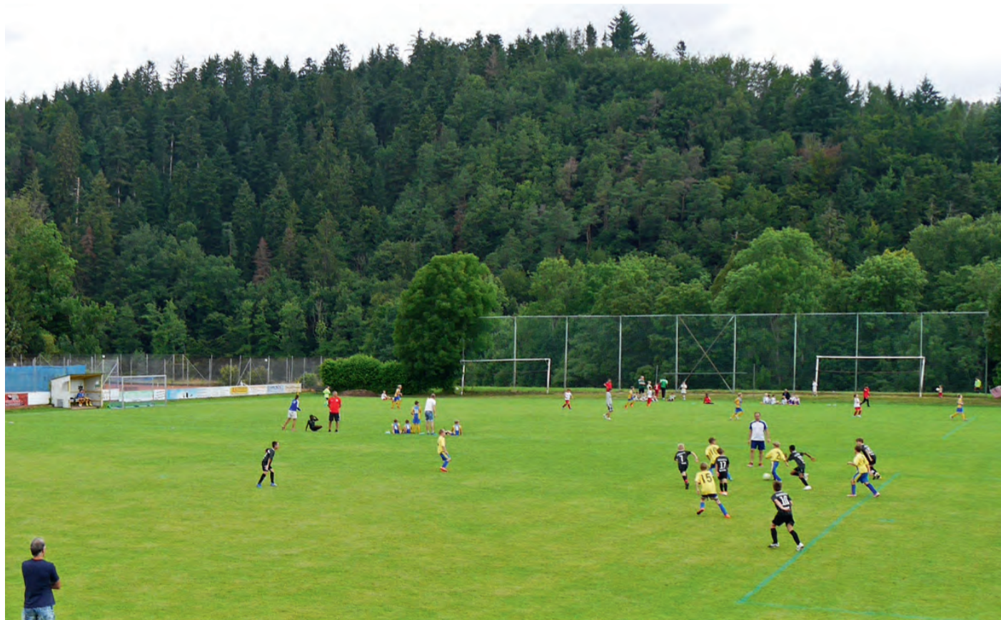
Mit viel Freude kämpfen Kinder- und Jugendmannschaften beim Turnier.