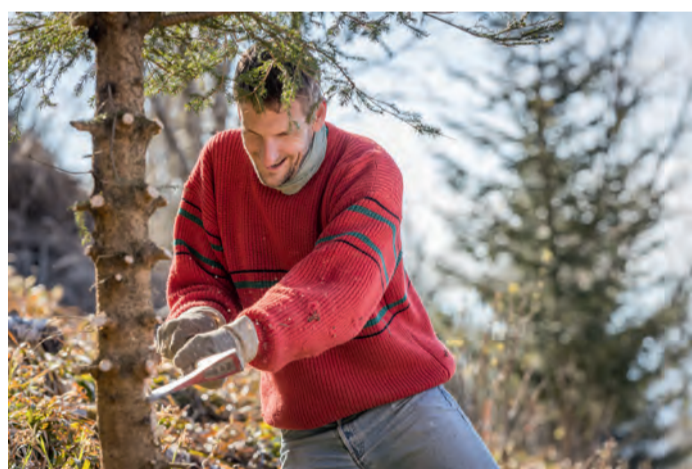
Beim Volontourismus können Gäste in ihrem Urlaub unter fachkundiger Anleitung etwas Gutes für die Umwelt tun.

Während sich die Einsätze im Südschwarzwald 2021 hauptsächlich auf den Feldberg und den