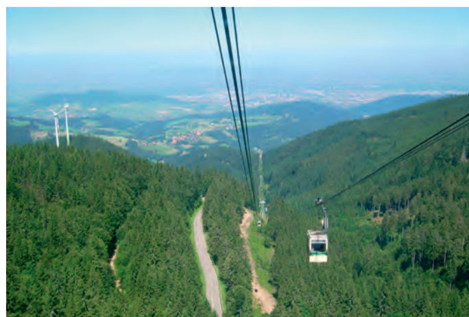
Schon während der Seilbahnfahrt kann man sich per Audiotour auf die Erlebniswelt Schauinsland einstimmen.

den Schauinsland bietet für jeden etwas: spazieren gehen entlang den weltbekanntesten knorrigen Windbuchen und durch blühende Kräuterpiesen oder wandern auf gut angelegten und ausgeschilderten Wegen, zum Gipfel mit Aussichtsturm. Für Biker sind interessante Trails angelegt. Wer Ruhe und Gemütlichkeit bevorzugt, sollte in eines der urigen Gasthäuser zum