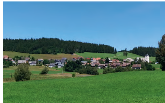
Blick auf Breitnau

Dank Mittel aus dem Ausgleichsstock können wir dringend nötige Straßensanierungen in Angriff nehmen, die seit Ende Juni laufen.