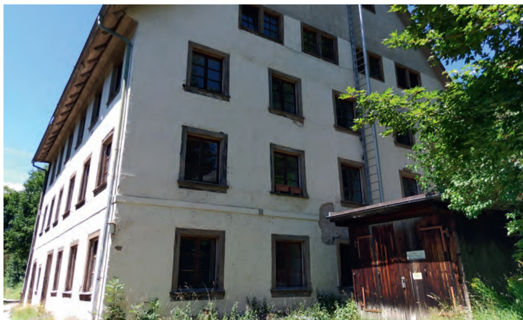
Der alte Hirschen liegt auf Breitnauer Gemarkung hinter einem Grünstreifen versteckt direkt an der B 31 nahe der Tankstelle. Dort wird ein kleines Mischgebiet entwickelt, wo sich Handwerksbetriebe ansiedeln können.