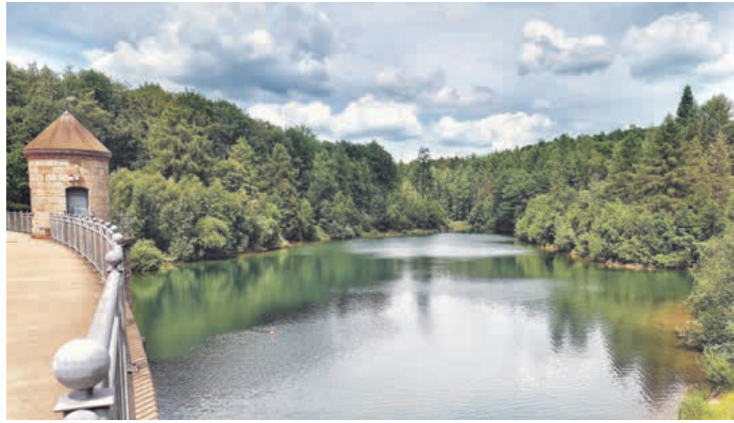
So verlockend das Wasser in der Ronsdorfer Talsperre auch ist: Schwimmen ist hier verboten.

Die Badesaison an den Talsperren ist offiziell eröffnet und geht bis zum 15. September. Einige Talsperren des Wupperverbandes, z. B. die Ronsdorfer Talsperre oder der Stausee Beyenburg, sind keine Badegewässer. Hier ist das Baden nicht erlaubt.