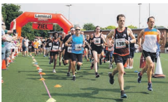
Trotz schweißtreibender Temperaturen war das Starterfeld gut gefüllt.

Das sportliche Konzept blieb auch bei der vierten Auflage unverändert: Der Lauf startete mit Strecken für die Bambini über 400 Meter und für die Schüler über 800 Meter, ehe die Walker auf die 5,45 km lange Strecke quer durchs Bergische Land geschickt wurden. Es folgte der Volkslauf ebenfalls über 5,45 km